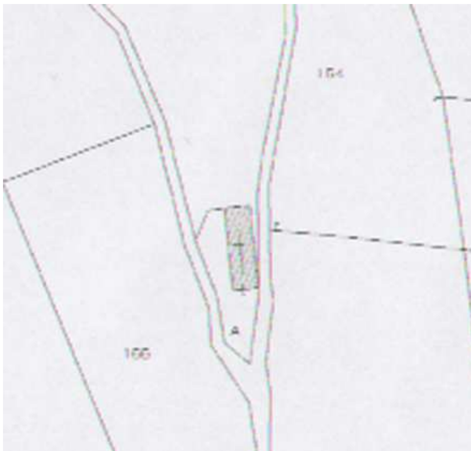
Stralcio di mappa catastale